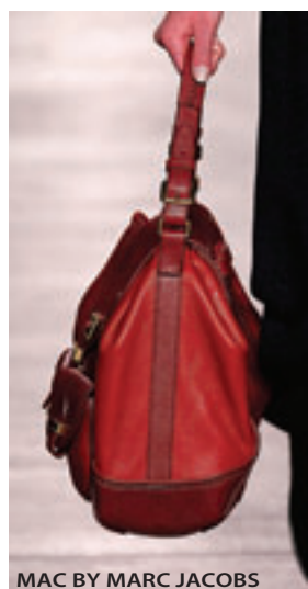
MAC BY MARC JACOBS