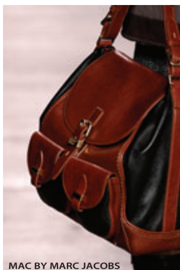
MAC BY MARC JACOBS